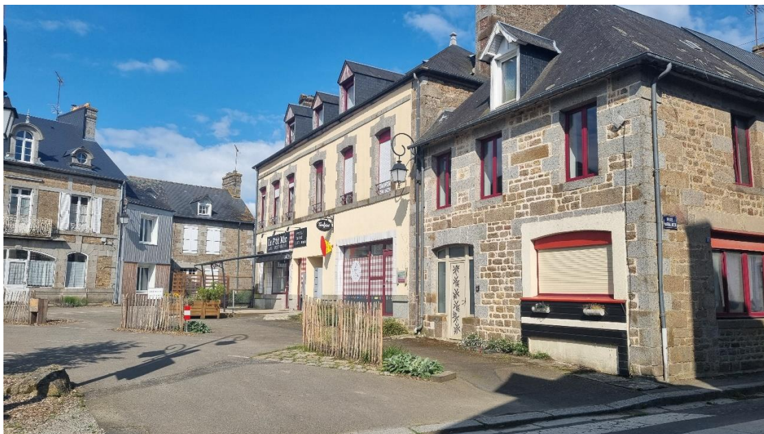
« Le P'tit Mic » vu depuis la RD14