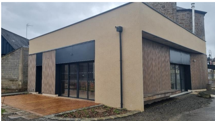
« Le P'tit Mic » extension neuve – Façade Sud (rue de la Fieffe)