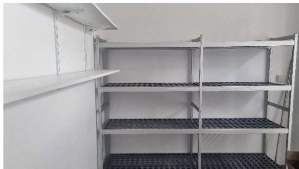
La cuisine + rangements épicerie sèche + chambre froide