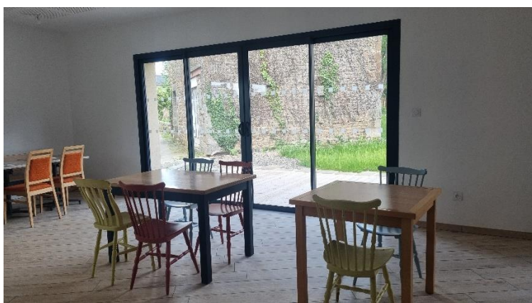
La salle de restauration (45 couverts)