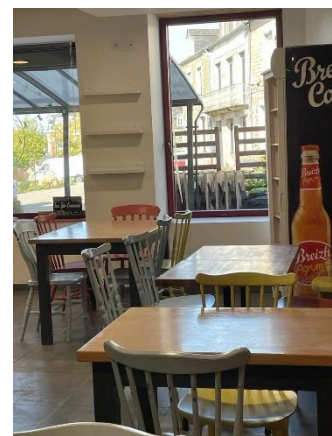
Le bar/ tabac/ Française des jeux + petite salle bar