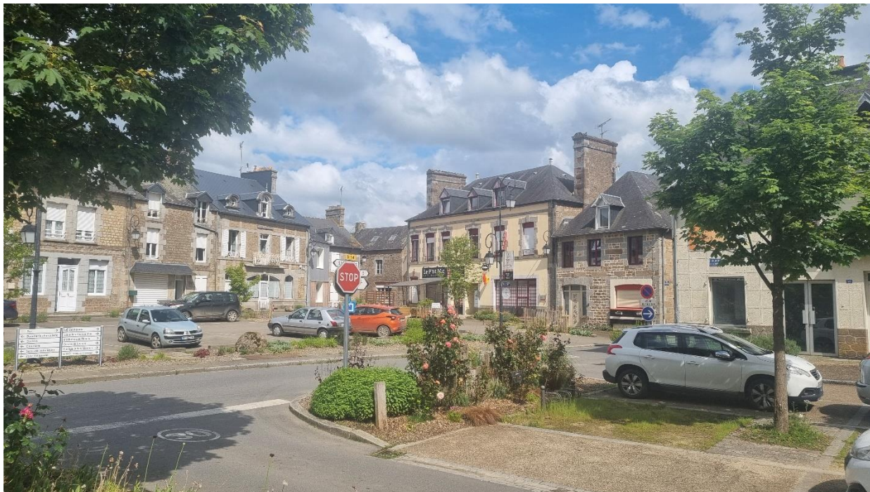
« Le P'tit Mic » vu depuis le perron de la Mairie