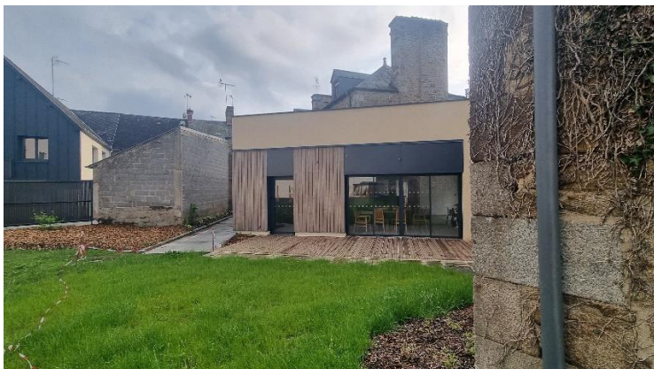
« Le P'tit Mic » extension neuve – vu depuis le jardin attenant

Un jardin partagé accessible depuis la terrasse rue de la Fieffe. Il est animé par le Conseil Municipal des Jeunes et un animateur environnement.