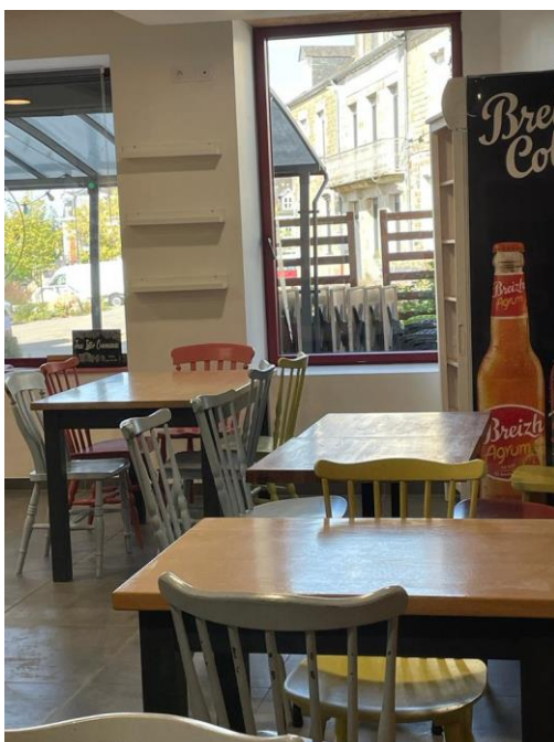
Petite salle à proximité de bar

(Plus de photos disponibles sur demande)