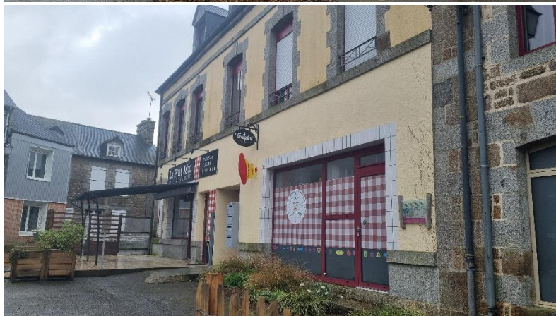
Le commerce « Le P'tit Mic », côté Place de La Mairie