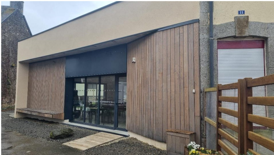
Le commerce « Le P'tit Mic », (extension neuve) côté Rue de la Fieffe