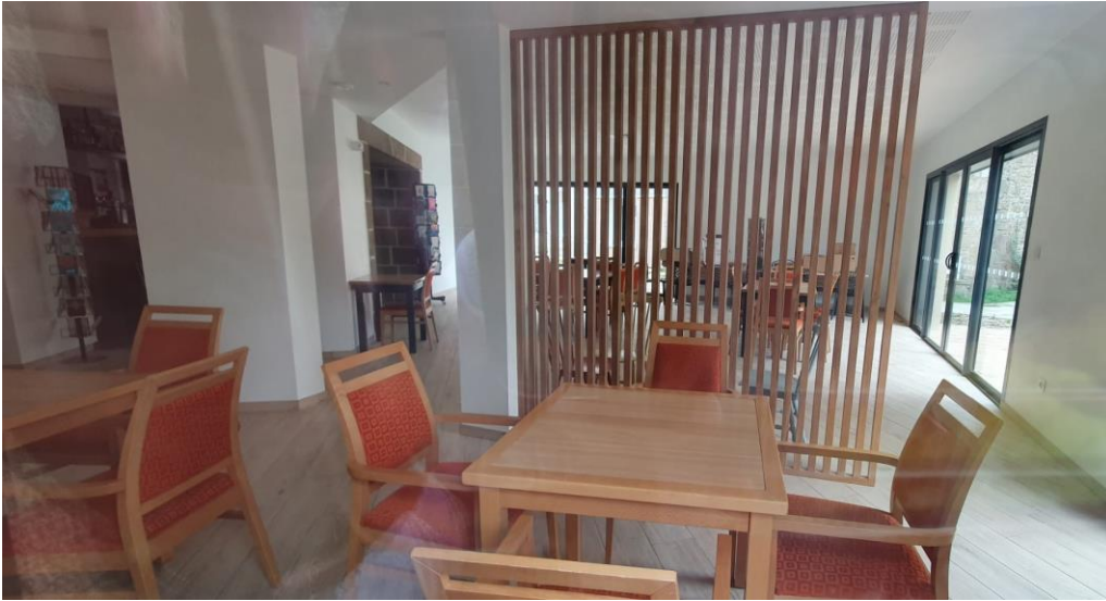
Grande salle de restauration (37 places)

Un jardin partagé accessible depuis la terrasse rue de la Fieffe.